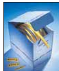
Gjenvinnbare bokser beskytter krympeslangen mot støv og fuktighet.

Alle dimensjoner i mm. Med forbehold om tekniske endringer.